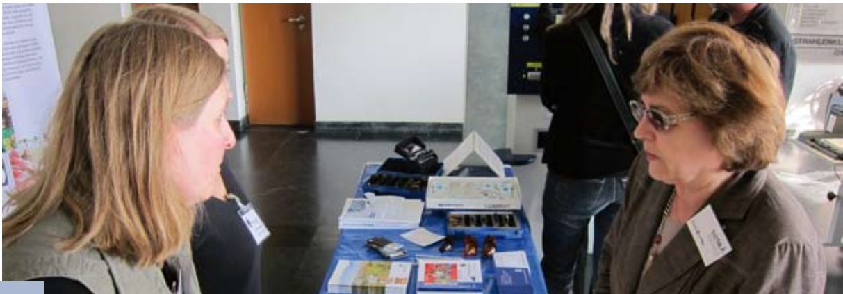
Bilder: Woche des Sehens

Was bedeutet Augeninnendruck und liegt er bei mir im gesunden Bereich? Was kann ich tun, wenn mein Kind sehbehindert ist? Wie kann ich mit einer Sehbehinderung lesen? Diese und andere Fragen wurden am 13. Oktober in Würzburg beantwortet. Die Augenklinik des Universitätsklinikums hatte einen Nachmittag lang seine Pforten für interessierte Besucher geöffnet. Der Bayerische Blinden- und Sehbehindertenbund e.V., die PRO RETINA, das Berufsförderungswerk, die Low Vision Ambulanz, die Blindeninstitutsstiftung sowie die Low Vision Ambulanz der Augenklinik informierten gemeinsam im Foyer der Klinik die Besucher über ihre Arbeit. Interessierte Bürger waren eingeladen, durch kostenlose Sehtests und Augendruckmessungen, Hilfsmittelpräsentationen und medizinische Vorträge tiefer in die Themen einzusteigen.