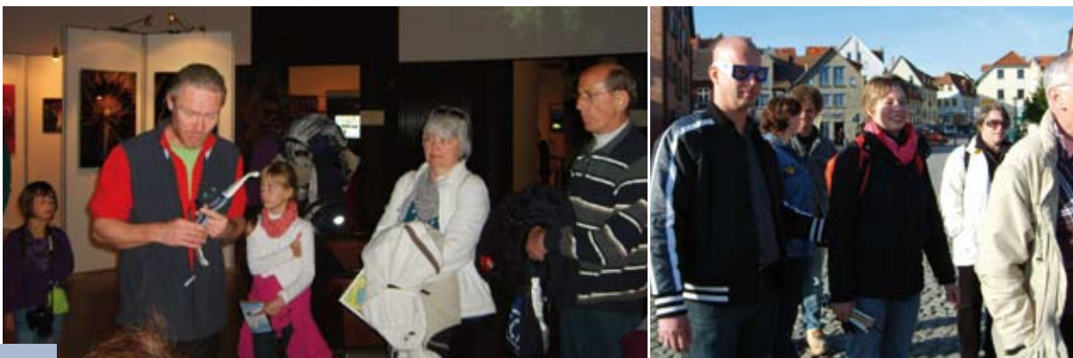
Bilder: Woche des Sehens / West

Am 13. Oktober boten das Projekt „Tourismus für Alle“ und der Tourismusverband Mecklenburgische Seenplatte e.V. barrierefreie Führungen für blinde, sehbehinderte und sehende Besucher durch das Warener MÜRITZEUM sowie die historische Altstadt. Mit Simulationsbrille versetzten sich einige sehende Teilnehmer in die Rolle eines Betroffenen und erkundeten auf diese Weise das Natur-Erlebnis-Zentrum und die Warener Straßen. Weitere Angebote während der Projektwoche waren barrierefreie Kirchenführungen, der Besuch des Bärenwaldes in Stuer sowie Vorträge über Barrierefreiheit.