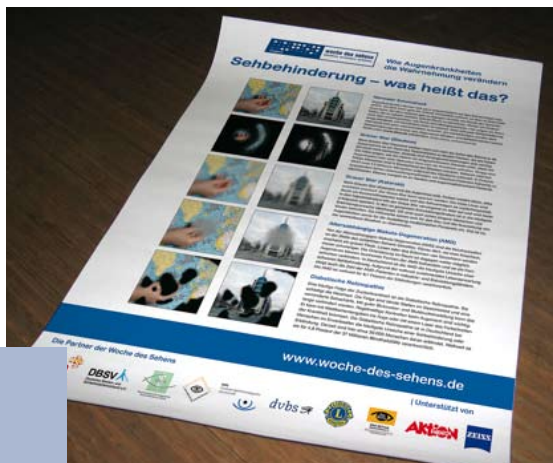
Das Plakat „Sehbehinderung – was heißt das?“

Das Plakat wurde in einer Auflage von 25.000 Stück gedruckt und jedem Materialpaket, Publikationen der Woche-des-Sehens-Partner sowie den Kongresstaschen des WOC (World Ophthalmology Congress) beigelegt und konnte bei den Koordinatorinnen bestellt werden.