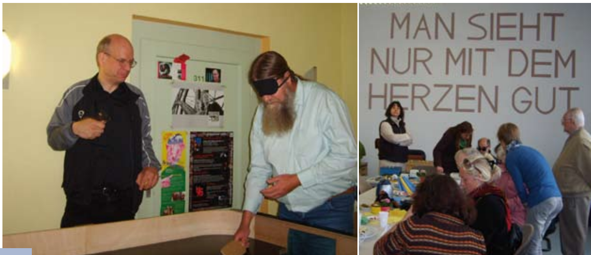
Bilder: Woche des Sehens / West

In einem Vortrag erfuhren sie alles über den Blindenführhund und es bestand die Möglichkeit, die Blindenschrift kennenzulernen. Ein Referent des Deutschen Blinden- und Sehbehindertenverbandes aus Berlin war mit einer Tischballplatte angereist und wies in die Regeln des Spiels ein. Auch das Angebot des gemeinsamen Kaffeetrinkens als Treffpunkt und Austauschmöglichkeit kam bei den Besuchern gut an.